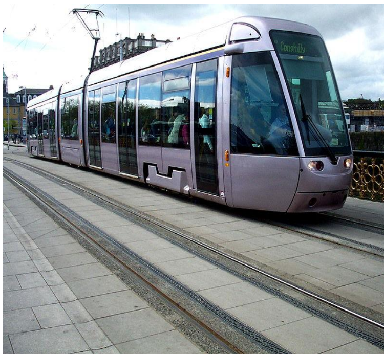
VLT – Dublin Irlanda