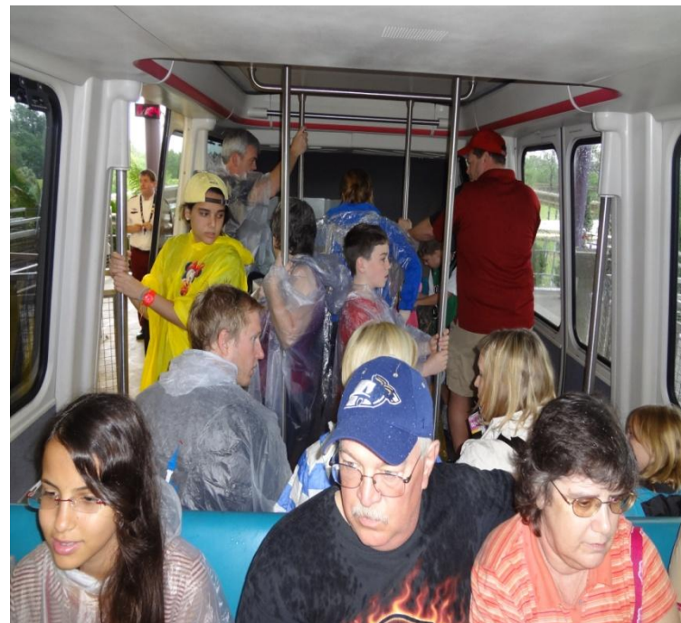
Ocupação Interna Monotrilho