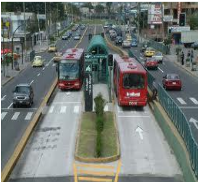
BRT Pista Simples