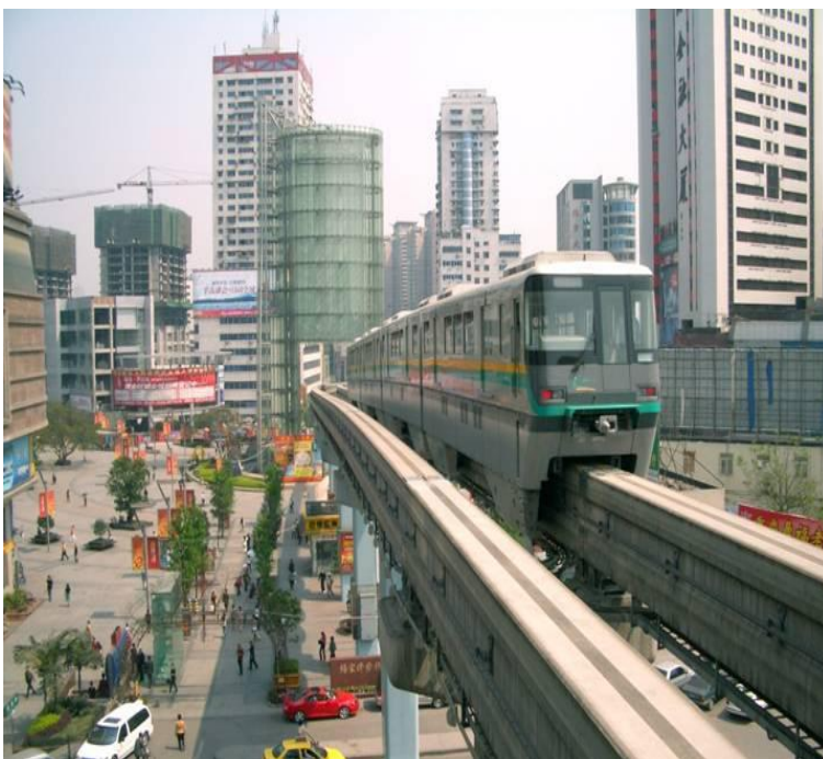
Monotrilho Chongqing - China