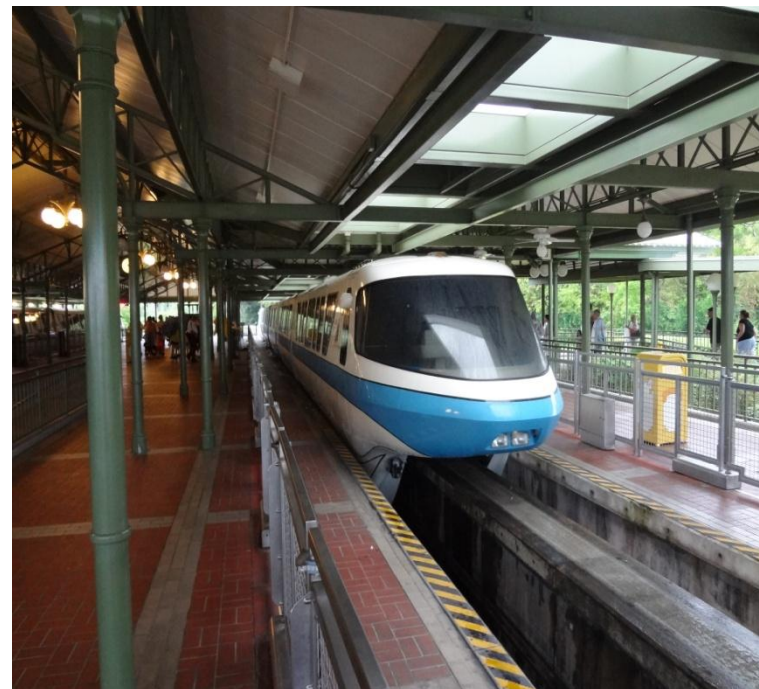
Vista Frontal Monotrilho