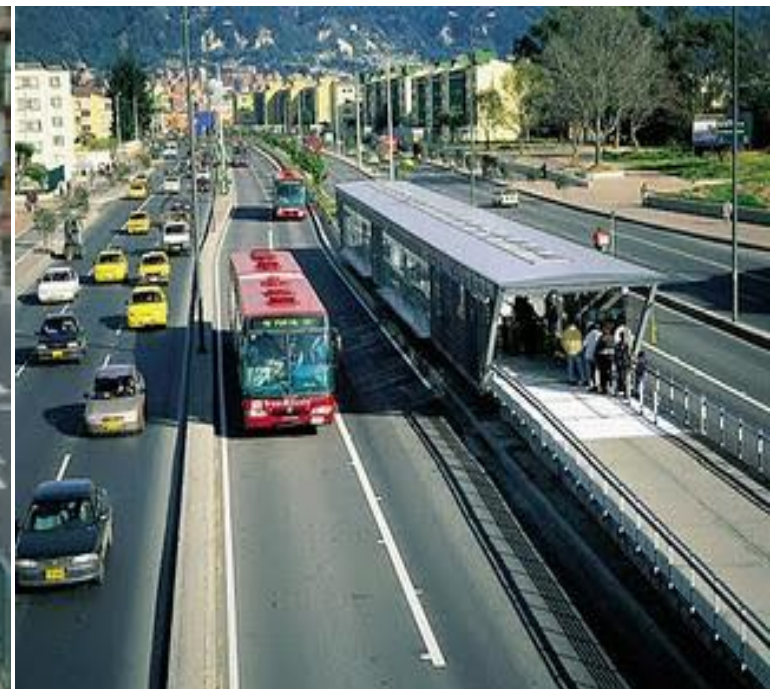
BRT Pista Dupla Segregada