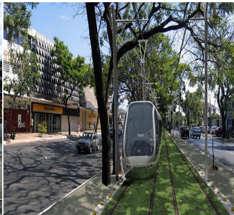
Disposição do VLT