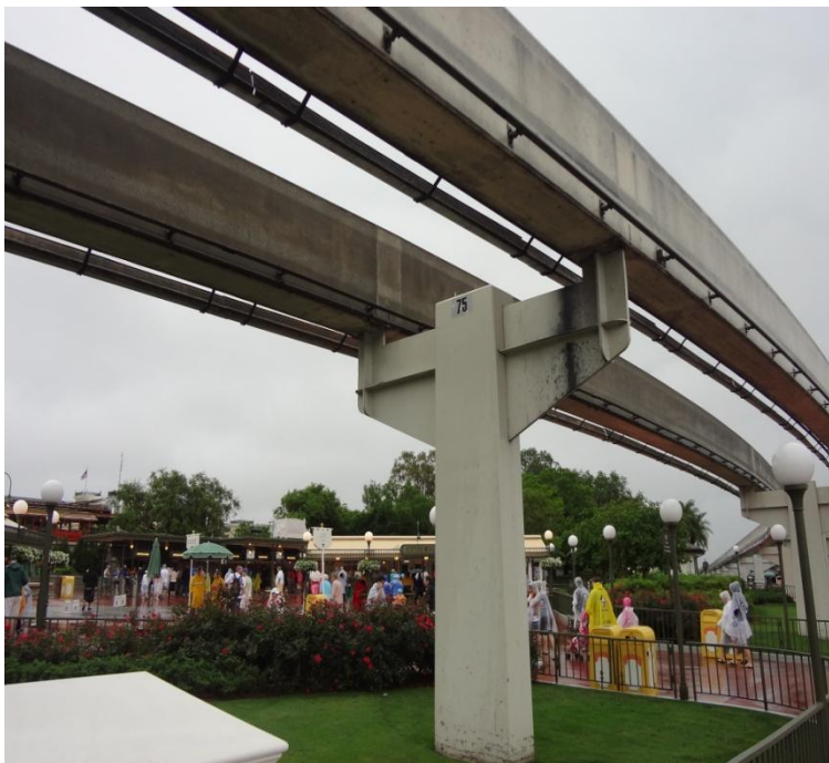
Vigas de Sustentação Monotrilho